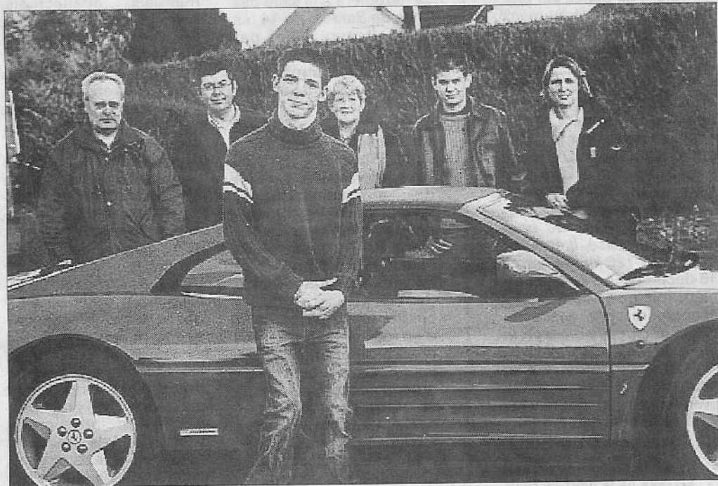
L'association Sogno di Cavallino, à Ficheux, a pour objectif d'offrir des essais routiers en Ferrari à des personnes handicapées. Le 3 décembre, plusieurs Ferrari seront à Tilloy.

Chacun peut réserver des cases sur les grilles (2 € la case) en téléphonant à l'association Sogno di Cavallino au 03 21 15 01 80 ou en adressant un mail à patrice@sogno-di-cavallino.org Site internet : sogno-di-cavallino.org